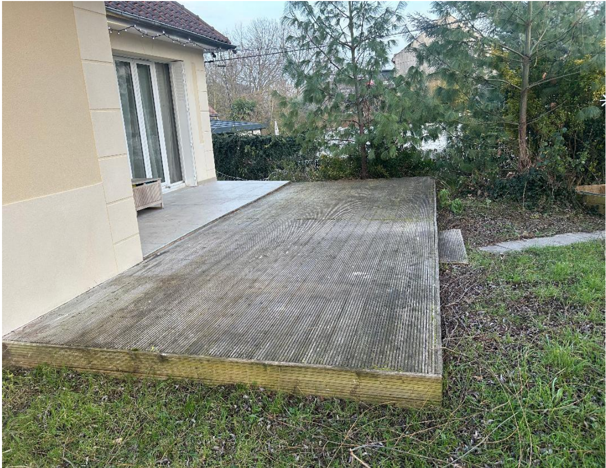
PHOTO D'ENSEMBLE AVANT TRAVAUX

Dépose d'une terrasse bois 6x3.5 mètres, dépose des chevrons sous la terrasse Prévoir évacuation des matériaux